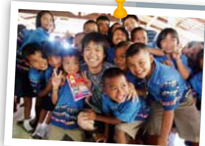
タイでの国際交流活動