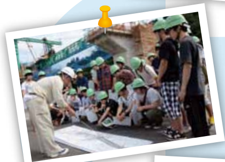
インフラについて学ぶ 学生の様子