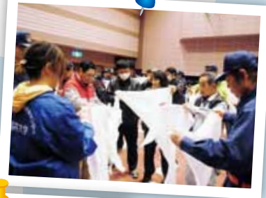
学生と自治体による 地域防災講習会の様子