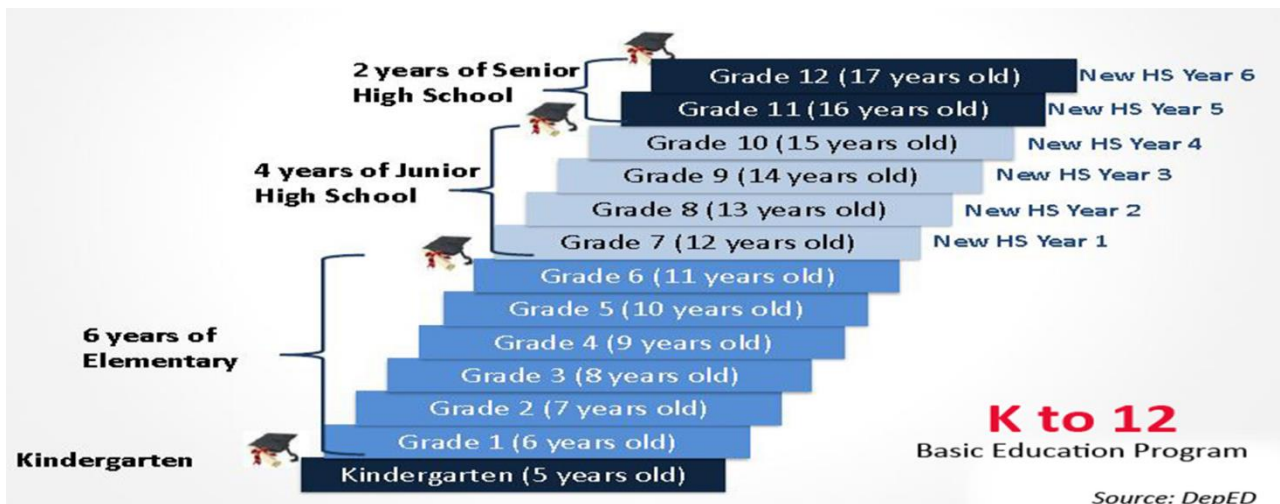
Figure 1: 私の国の教育システム

私の国は2011年から幼稚園-12年生基礎教育プログラムを実施始しています。K to 12 BEPは、幼稚園から高校までです。幼稚園は、1年です。小学校は、6年です。中学校は、4年です。高校は、2年です。私の国の義務教育は、13年です。