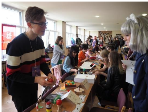
←Anime Night の様子

これまで私自身、インドやタイで日本の文化についてプレゼンテーションをする機会があり、そのたびに日本文化の魅力を実感してきました。リトアニアでもこのサークルに参加することで、その良さを発信していきたいです。