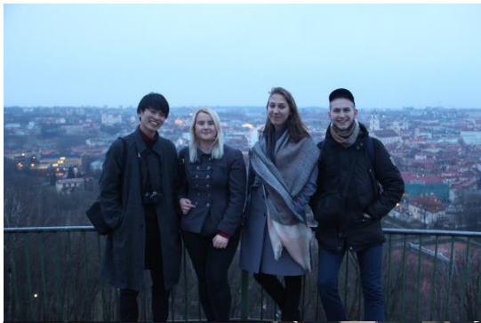
←The Hill of Three Crosses (in ヴィリニユス) Cade valley→ (in カウナス) 自然豊かできれいな場 所がたくさん！ん！