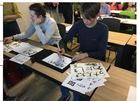
橋で書道のワークショップ→