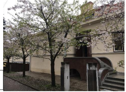
記念館正門の桜の様子

今月の25日に記念館前の桜の開花を祝うと同時に、記念館運営に当たって関係者、地元の学生や近所の方への感謝を伝えるためのSakura Blossom Celebrationという式典が催されました。このような定期的な行事の準備や運営もしています。