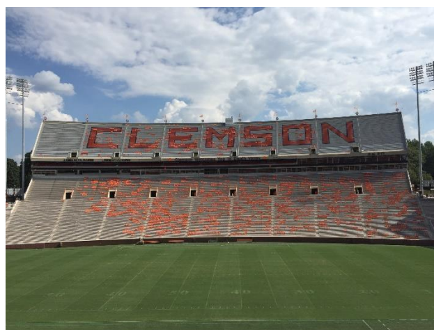
約8万人収容可能なスタジアム