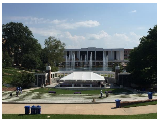
図書館 目の前には巨大な噴水

ここクレムソン大学は、とても規模が大きい大学です。現地の学生に聞くと、アメリカの中では田舎で大学自体も大きくはないと言いますが、やはり日本とはすべてにおいて規模が違います。実際、学生数も1万8千人を超えていて、敷地も広く、学内には常にバスが走っています。施設も充実していて、図書館をはじめ、スターバックスなどの飲食店、ジムや運動できる場所も多くあります。図書館を初めて見たときは、思わず博物館かよと突っ込んでしまいました。そしてなにより感動したのが、アメリカンフットボールのスタジアムがあることです。クレムソン大学は去年の全米チャンピオンで、アメフトにとっても力を入れています。来月から試合が始まるので、また次回以降詳しく紹介していこうと思います。また、キャンパスカラーがオレンジなため、部活の試合があるときや毎週金曜日はみんなオレンジのシャツを着ていて、大学愛が強いなども感じました。