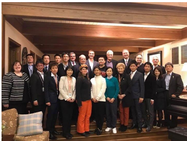
Fukui Reception での集合写真

従来のレセプションとは異なり、福井県の実業家の方々をお招きして行われました。福井県の実業家として活躍する方々から直接たくさん貴重なお話を聞くことが出来、自らが留学を終え、大学を卒業したその後のことを考えるにあたって、非常に刺激の多いお話をたくさん聞くことが出来ました。また、同じ地元出身ということで、地元である福井に関する話も久しぶりにすることが出来、久しぶりに心からリラックスして時間を過ごすことが出来ました。