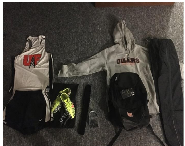
大学から支給されたもの