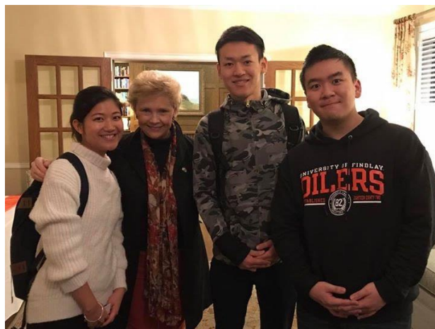
フェル学長と福井県からの留学生