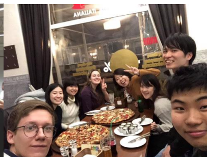
大好きな 50cm ピザ