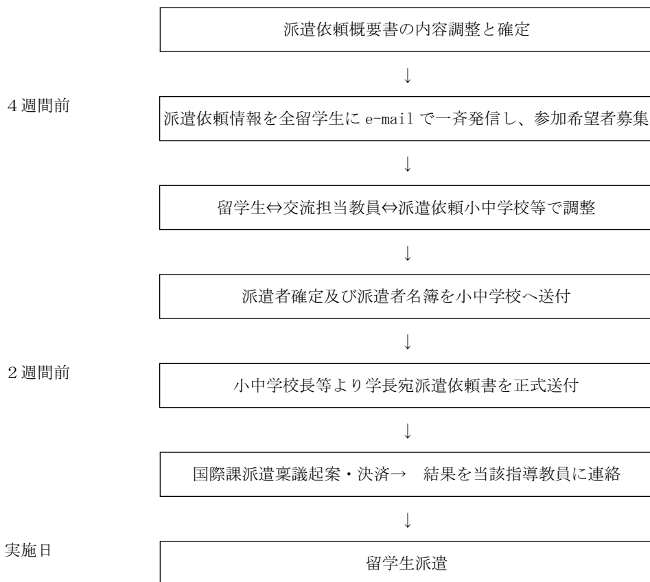
表 10 平成 18 年度の留学生派遣実績