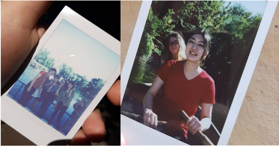
ルーマニア人の友達2人と、日本人の友達と一緒に Cismigiu Park に行って、ボートに乗ったときの写真。