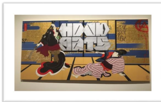
日本の芸術も美術館に展示されてありました。海外の視点から見た日本についてもこれから知ってみたいです。