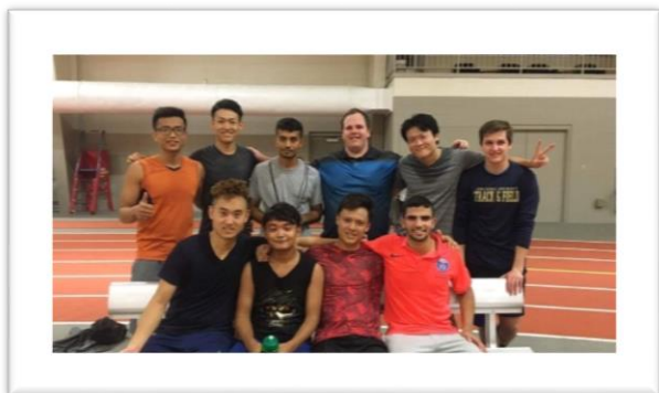
一緒にサッカーをした友達と週末の夜に開催されるため、積極的に参加して交流を図っています。

週末も留学に来てまでゴロゴロ過ごすのはもったいないと、常に現地の学生と交流できるように予定を立てることを意識しています。週末には隣町の Toledo にある美術館に行ったり、友達の家でホームステイさせてもらったりと、リラックスしながらも充実した週末を過ごすことができています。