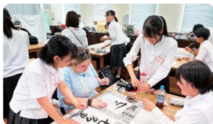
令和5年度米国受入事業 (越前町国際交流協会)