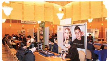
留学生合同企業説明会 (福井県国際交流協会)