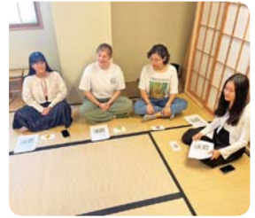
部活動体験 (ふくい市民国際交流協会)