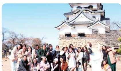
校外学習・彦根城 (青池調理師専門学校)