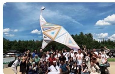
見学旅行・福井県立恐竜博物館 (福井大学)