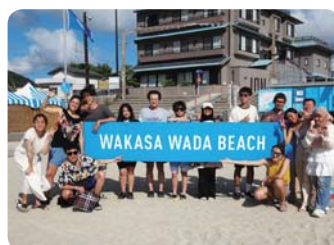
留学生サマーキャンプ (福井大学)