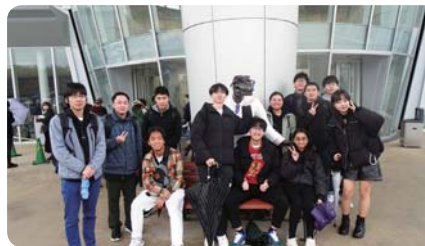
留学生研修旅行 (福井工業高等専門学校)