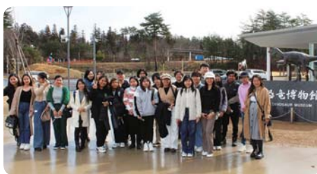
福井県立恐竜博物館見学 (福井県医療福祉専門学校)