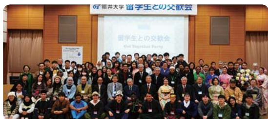
留学生との交歓会 (福井大学)