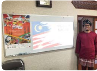
外国人講師派遣ーマレーシア (ふくい市民国際交流協会)