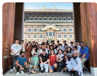
見学旅行・越前大仏 (福井大学)