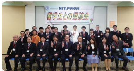
留学生との懇談会 (福井工業高等専門学校)