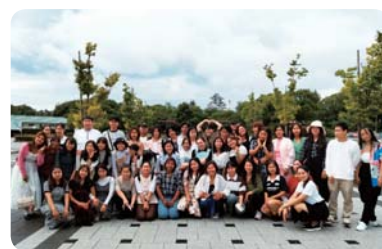
校外学習・滋賀 (福井県医療福祉専門学校)