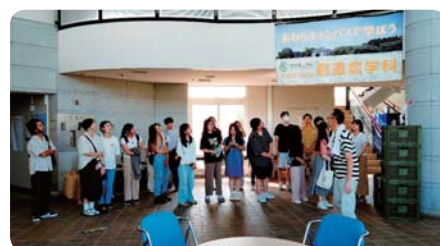
留学生バスツアー・キャンパス見学 (福井県立大学)