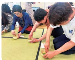
茶道体験 (福井県立大学)