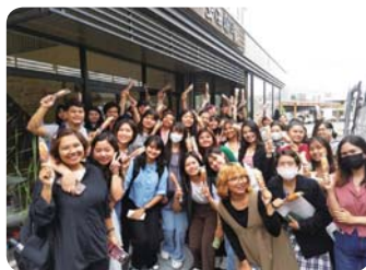
蒲鉾作り体験 (福井県医療福祉専門学校)