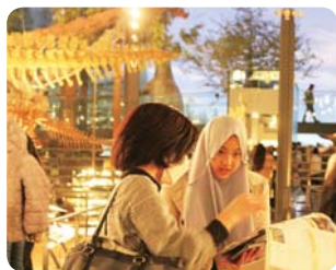
福井県立恐竜博物館見学 (福井県医療福祉専門学校)