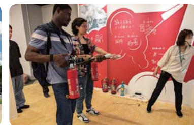
防災センター見学 (福井大学)