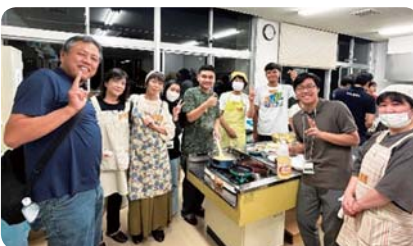
異文化理解講座 (越前町国際交流協会)