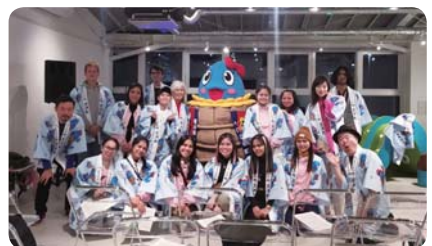
校外学習・インバウンドツアー (青池調理師専門学校)