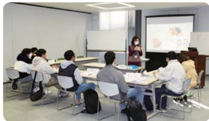
日本語常設講座 (福井県国際交流協会)