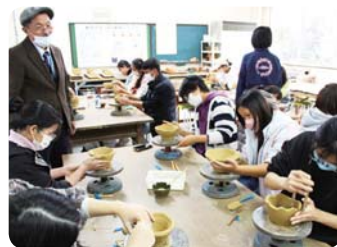
陶芸体験 (福井県医療福祉専門学校)