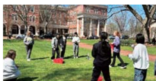
令和5年度米国派遣事業

越前町は、米国アラバマ州モンテパロ市及び豪州南オーストラリア州のバードウッド高校との交流協定を結び、長年にわたり中学・高校の生徒の相互派遣交流を実施しています。令和6年度までに、越前町から481名が派遣され、342名を受け入れてきました。また、マレーシアとの交流も盛んで、毎年マレーシア国費留学生向けのサマーキャンプを実施しています。過去には、韓国のヨンドク郡と、タイ王国カセサート大学附属小学校との交流も行ってきました。