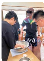
見学旅行・六呂師高原 (福井大学)