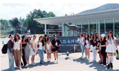
校外学習・福井県立恐竜博物館 (青池調理師専門学校)