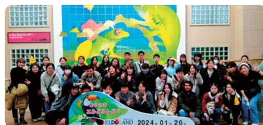
留学生バスツアー (福井県立大学)