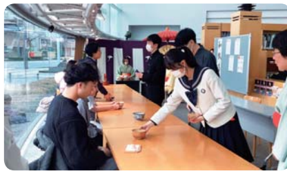
おちゃっとサロン「茶道」 (福井県国際交流協会)