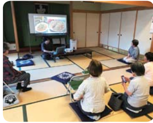
外国人講師派遣ー中国 (ふくい市民国際交流協会)