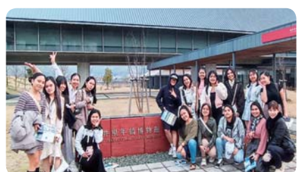
校外学習・福井県年輪博物館 (青池調理師専門学校)