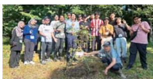
令和6年度マレーシア留学生サマーキャンプ