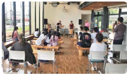
民族楽器体験 (ふくい市民国際交流協会)