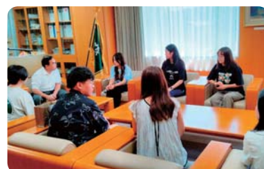
帰国前学長表敬 (福井県立大学)