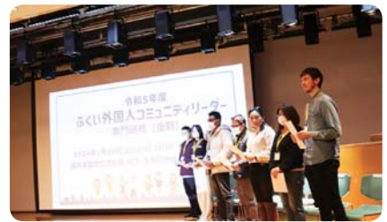
ふくい外国人コミュニティリーダー認定 (福井県国際交流協会)