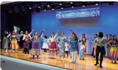
福井国際フェスティバル2023 (福井県国際交流協会)