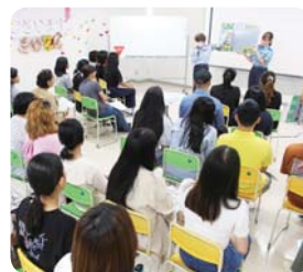
生活安全講習会 (福井県医療福祉専門学校)