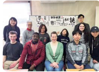
書道体験 (ふくい市民国際交流協会)