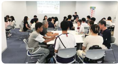
しゃべり場 (ふくい市民国際交流協会)