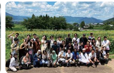
見学旅行・スターランドさかたに (福井大学)