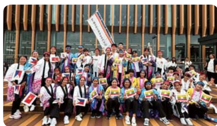
フェニックス祭り YOSAKOI (福井県医療福祉専門学校)