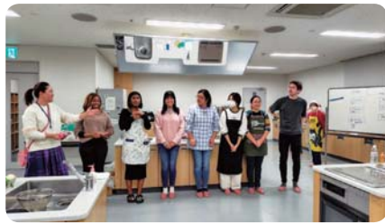
クッキング (ふくい市民国際交流協会)