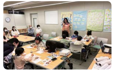
ワールドkidsくらぶ「グアテマラ編」 (ふくい市民国際交流協会)