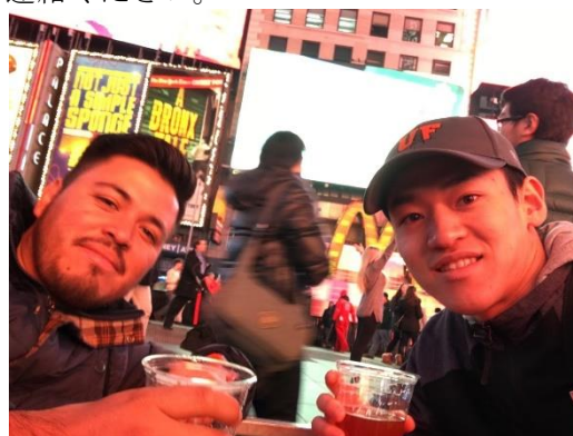
メキシコの方と、タイムズスクエアにて