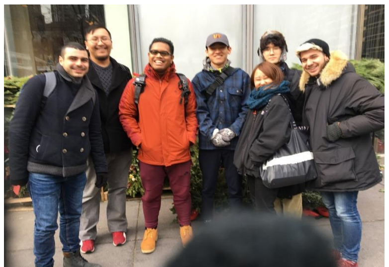
カウチサーフィンで出会った人々