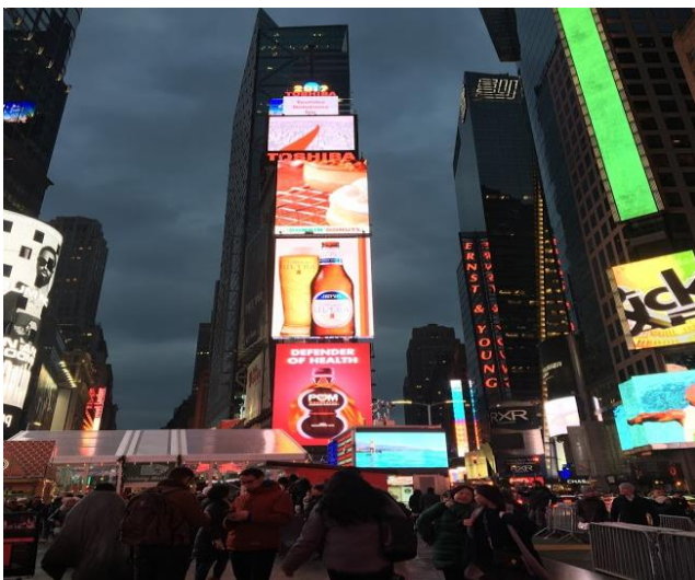
タイムズスクエア