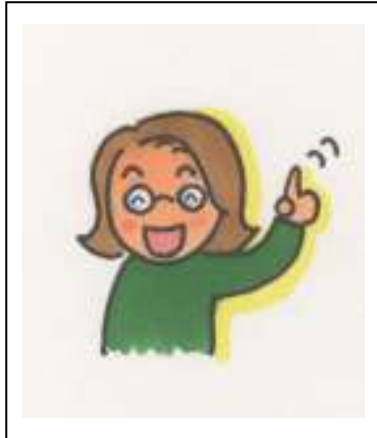
知っていますか？女性のからだ