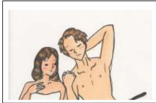
ひと夏の経験の前に知っておきたいこと